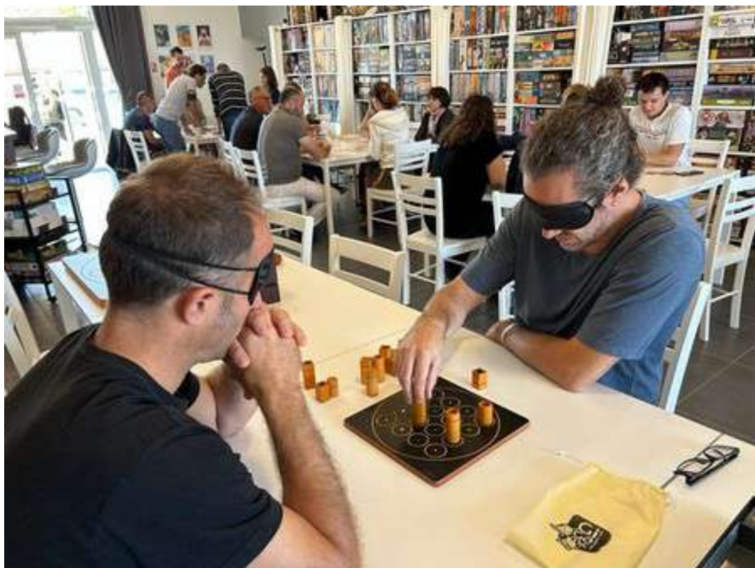
Partie de Quarto® en accessibilité aux déficients visuels lors d'une soirée jeu