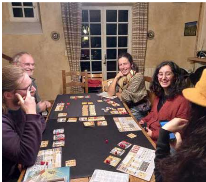
Des vacanciers en pleine partie

Impliqués depuis des années dans le monde ludique, certains d'entre eux sont ludothécaires, auteurs de jeux, animent des chaînes thématiques ou des chroniques sur les réseaux sociaux, organisent des séminaires, des soirées jeux, tiennent des cafés ludiques ou une boutique de jeux. D'autres sont juste des joueurs frénétiques et des collectionneurs compulsifs. Tous ont en commun la passion du jeu de société moderne et la conviction que c'est un formidable vecteur d'échange et de transmission.