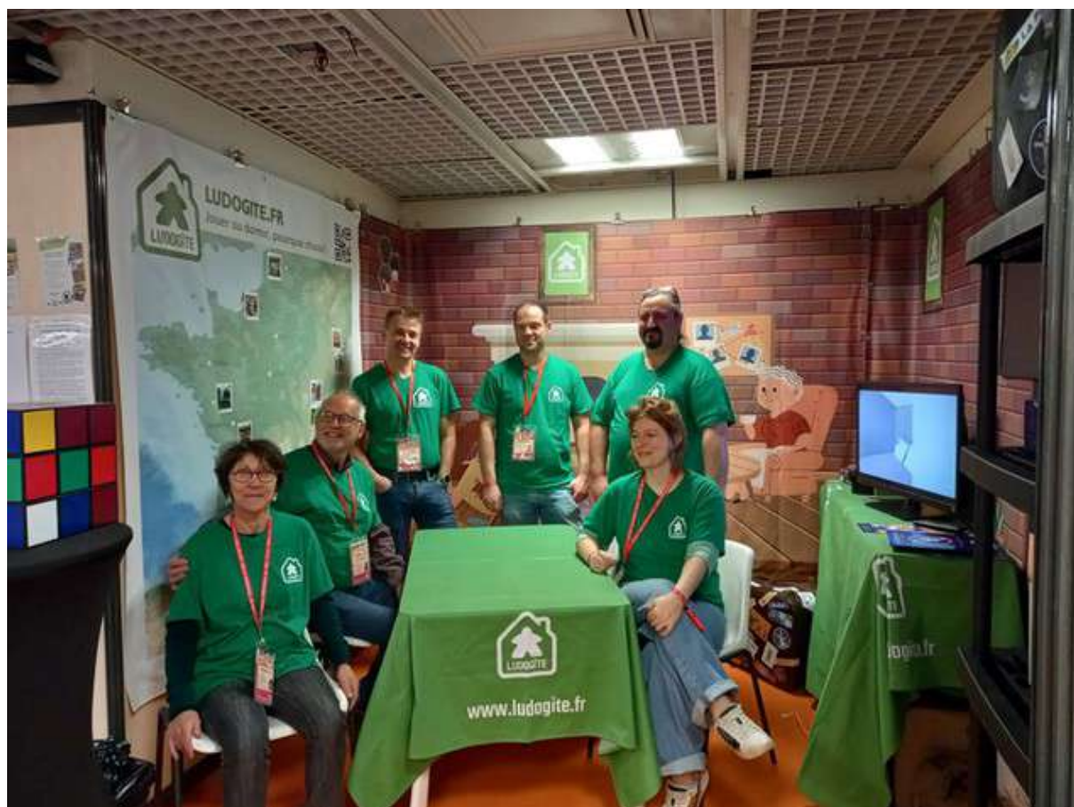
Le stand des Ludogîtes lors du Festival International des Jeux de Cannes en 2024

Une ludothèque riche et diversifiée, enrichie régulièrement de nouveautés.