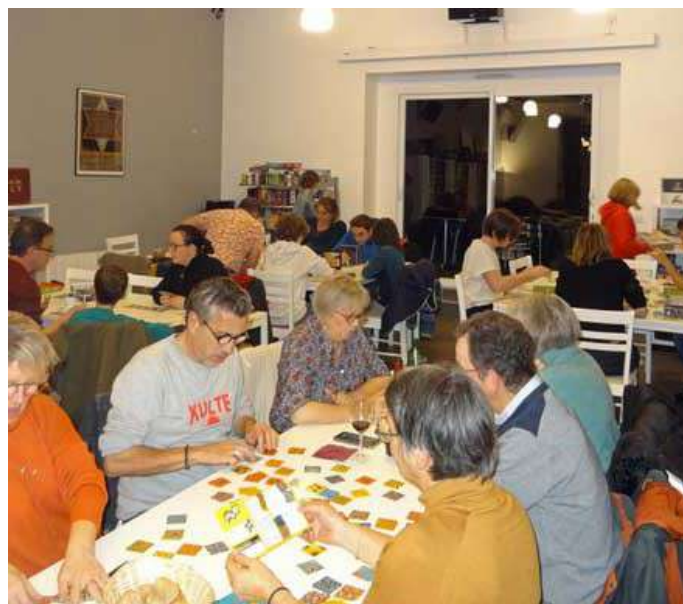
Soirée jeux dans un Ludogîte

En 2023, c'est plus de 1500 nouveaux jeux de société qui ont été proposés en France. Cette actualité foisonnante, les Ludogîtes la suivent au quotidien et proposent à leurs visiteurs d'en profiter.