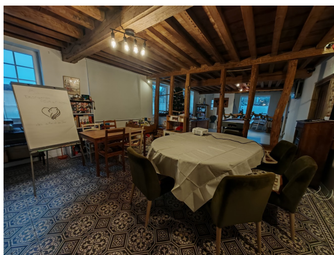
Séminaire, du Pain et des Jeux

Nous participons également à la création d'événements ludiques au sein de nos communes, communautés de communes, départements et sommes généralement acteurs des associations locales de joueurs.