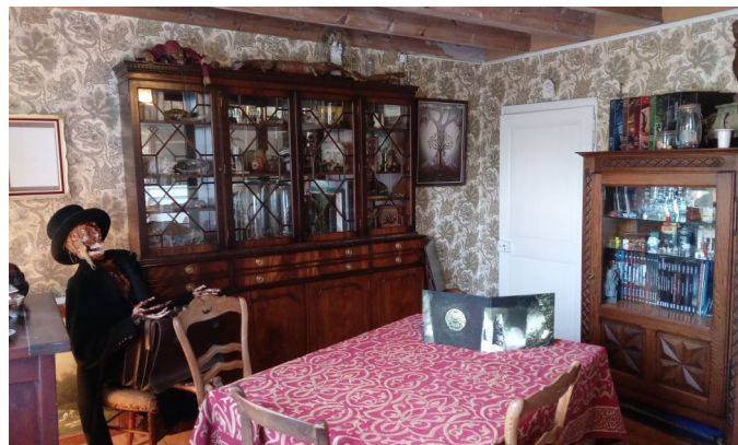
Escape Game, l'Inter Lude