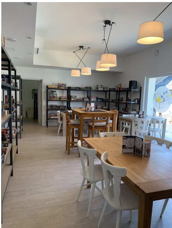
Ludothèque, La cachette Ludique

En fonction des Ludogîtes, différentes activités peuvent être organisées pour des séances de Team-Building ou pour agrémenter les réceptions : Escape-games, quêtes immersives, séances de cohésion d'équipe, murder party, activités peinture sur figurines, activités jeux de rôles, olympiades et