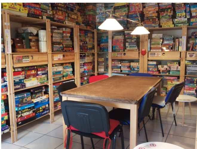
Ludothèque, L'Escale à Jeux

La majorité des Ludogîtes ont un partenariat avec une boutique locale vers laquelle nos clients sont dirigés lorsqu'ils désirent acquérir leurs découvertes ludiques : affichages, flyers, remises pour les clients, stock disponible parfois directement dans le Ludogîte (notamment lors des soirées dédiées à certains jeux et tournois).