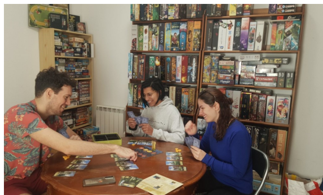
Animation jeu, Graine de Jeux

A l'entrée de la Ludothèque de chaque Ludogîte se trouve une étagère ou « vitrine » où sont mis en avant les nouveautés, les coups de cœur, les jeux reçus en dotation et une sélection de jeux adaptés à chaque fois aux voyageurs-joueurs reçus.