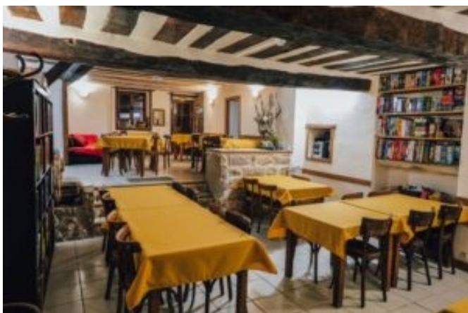
La Maison du Haut

La Maison du Haut : Saint-Lothain (39). Hébergement 19 pers. Réception jusqu'à 40 pers. Camping. Ecolieu. Concerts, débats, soirées jeux, ciné rencontres. Restauration végétarienne issue de l'agriculture biologique, des produits de saison et d'approvisionnements en circuits courts.