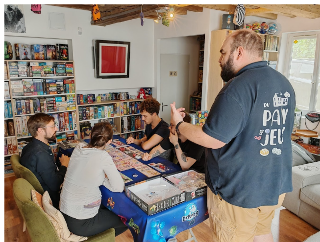
Animation jeu, du Pain et des Jeux