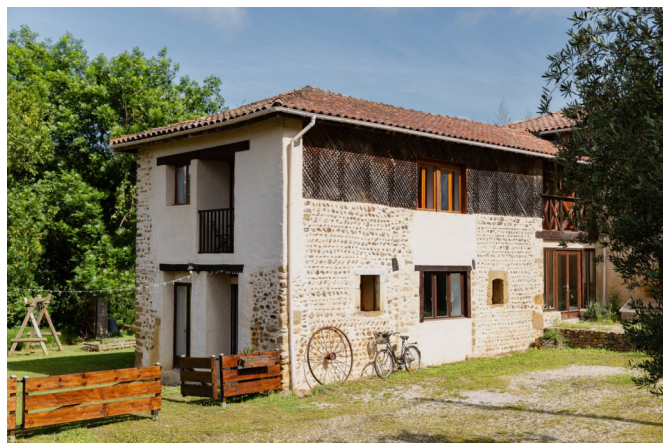
La Clef des Jeux

La Clef des Jeux : Montastruc (65). Hébergement 4 pers. Piscine.