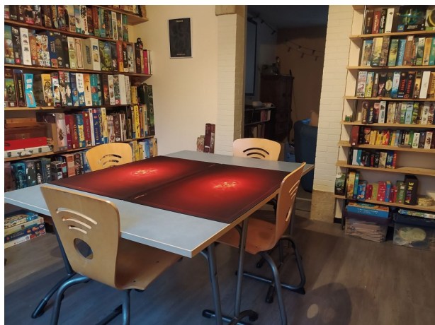
Ludothèque, Les Chambres Lud'hôtes

A l'entrée de la Ludothèque de chaque Ludogîte se trouve une étagère ou « vitrine » où sont mis en avant les nouveautés, les coups de cœur, les jeux reçus en dotation et une sélection de jeux adaptés à chaque fois aux voyageurs-joueurs reçus.